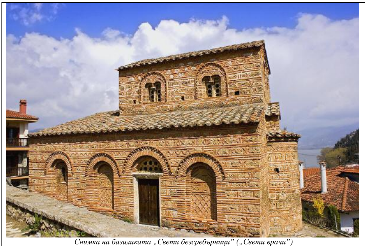
Снимка на базиликата „Свети безсребърници” („Свети врачи”)