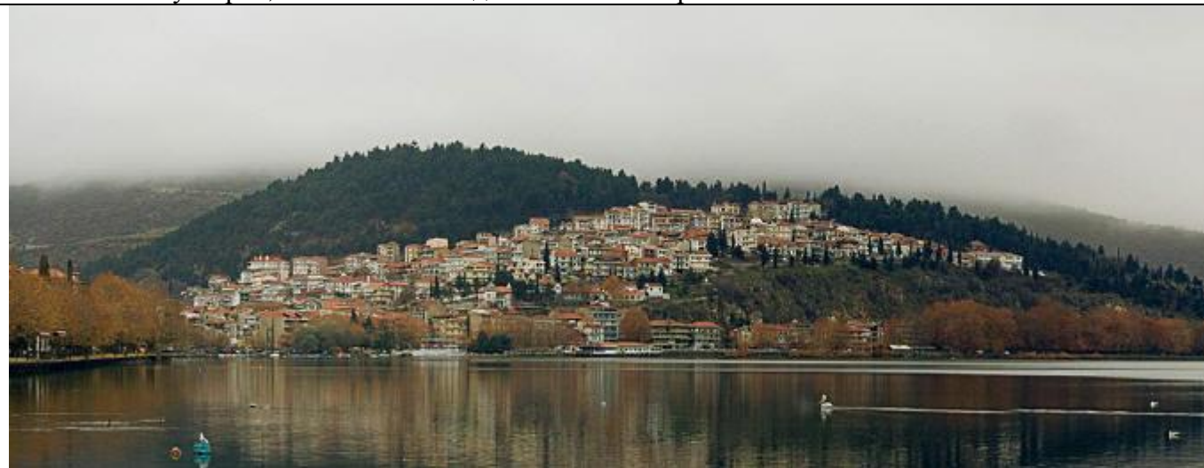
Панорамна снимка на града.

Костурско се намира в Егейска Македония, Гърция и представлява най-крайната югозападна част на българската езикова територия. Граничи с окръзите Лерин (Флорина) Кожени (Козани), Гребен (Гревена) и с Албания. Град Костур се намира в Костурската котловина, на 703 метра надморска височина, заобиколен от планинска верига, в която най-високи планини са Вич и Грамос. Старата част на града се намира в каменист полуостров, заобиколен от едноименното езеро.