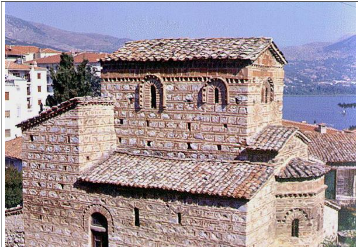
Снимка на базиликата „Свети Стефан“

Нравите, обичаите и празниците, като Великден и Коледа, Сирни заговезни, Трифон Зарезан и подрязването на лозовите пръчки, посрещането на пролетта и подаряването на саморъчно изработваните червено-бели мартеници, празнуването на бабин ден и др. са характерни и в Егейска Македония. Тези нрави и обичаи, особено подаряването на мартеници, не са известни в Южна Гърция.