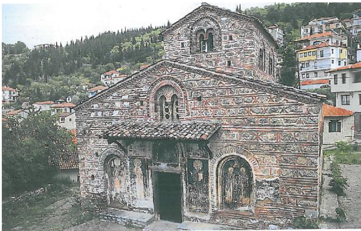
Снимка от северозападната ѝ страна на базиликата „Свети безсребърници” („Свети врачи”) със забележителните стенописи на черквата

този отдалечен край с майката родина - България. Сам Григор Пърличев в автобиографията си с голяма любов говори за костурските майстори, работещи в Атина по време на неговото следване там 9 .