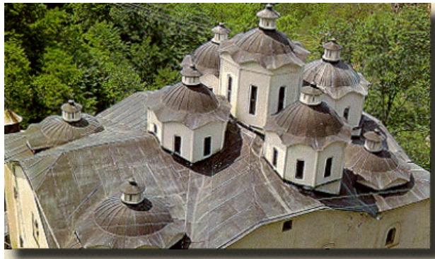
Поглед към манастира на св. Йоаким Осоговски

Светецът е един от тримата изявени последователи на св. Иван Рилски редом със св. Гаврил Лесновски и св. Прохор Пшински . Родното му място е неизвестно, знае се само, че дошъл от запад в Осоговската планина. Неизвестен по име болярин от Градец, недалеч от Крива Паланка (днес в Македония), му посочил търсеното място за монашеско уединение – една пещера край Сарандапор, днешната Крива река. Тук св. Йоаким прекарал живота си в пост и молитва, а местните българи го почитали като свят човек. След смъртта му през 1105 г. неколцина ловци го погребали пред неговата пещера. След още петдесет години овдовелият свещеник Теодор се заселил на същото място, приемайки монашеското име Теофан. Той открил чудотворните мощи на светеца, които били положени в построената в негова памет църква. В средата на XII в. култът на св. Йоаким станал толкова популярен, че около храма бил изграден едноименният манастир – светилник на българщината в този български край през следващите столетия. Манастирът бил посещаван от цар Калоян в началото на XIII в. В този манастир през 1393 г. самостоятелният български владетел на Северна Македония Константин Деянов (Драгаш) пренесъл от Търново мощите на св. Иларион Мъгленски.