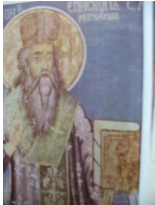
Св. Иларион Мъгленски (Стенопис от Араповския манастир, 1864 г.)

Бъдещият светец бил роден вероятно в Охрид или в някой от големите градове в диоцеза на Охридската архиепископия в знатно семейство. Получавайки добро образование, твърде млад той напуснал светския живот и постъпил в неизвестен по име манастир. Тук той прекарал много години, като бил избран за игумен. Ако съдим по известното ни за светеца, той може би е оглавявал някой от близките до старопрестолния Охрид манастири, създадени още в края на IX и началото на X в. от св. Климент и св. Наум. Едва ли трябва да се съмняваме, че в по-сетнешната си дейност св. Иларион е следвал техния пример, особено онзи на “първия епископ на българския народ” св. Климент Охридски.