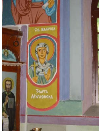
Св. Злата Мъгленска – стенопис от Калоферския манастир

Св. Злата Мъгленска била родена към 1770 г. в семейството на бедни християни от българското село Слатина, Мъгленско (Южна Македония, днес в Гърция). Злата израснала като красива и умна девойка. Един от тамошните турци я харесал, като насилнически я отвлякъл, когато тя заедно с други жени и девойки събирала дърва в гората. Отначало с различни ласкатества и обещания турчинът се опитвал да я склони да приеме мохамеданската вяра, но Злата твърдо отказвала. На свой ред местните кадъни месеци наред я убеждавали да изостави вярата си. Насилниците мюсюлмани заплашвали родители и нейните сестри, които се изплашили и също молели Злата да отстъпи. Девойката била много обидена от тяхното малодушие, като казала, че ще се отрече от тях, но не и от вярата в Исус Христос. Тогава девойката била подложена на бой и мъчения, дори я горили с нажежено желязо.