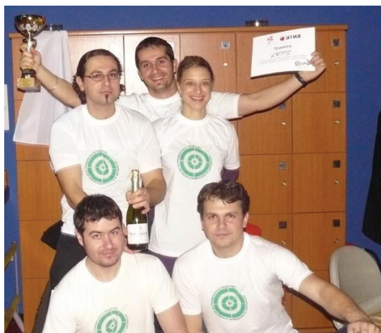
На снимката : Отборът на АРГО на боулинг турнир 2009.

В края на декември отборът на АРГО зае първо място в традиционния коледен боулинг турнир. Втори останаха младите хора от Института за решаване на конфликти, а трети-МПДС. В турнира участваха общо 18 отбора, представители на младежки политически и неправителствени организации с активна гражданска позиция.