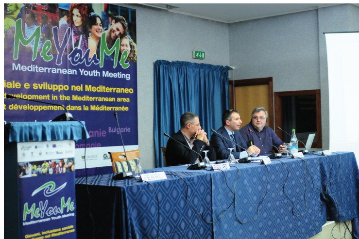
На снимката : проф. Галина говори за Средиземноморското сътрудничество и ползите от него